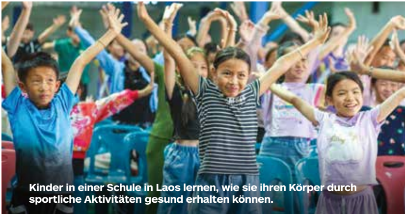
Kinder in einer Schule in Laos lernen, wie sie ihren Körper durch sportliche Aktivitäten gesund erhalten können.

Kimberley McMurray Adventist Record, und Adventist World