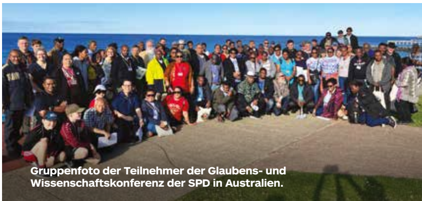
Gruppenfoto der Teilnehmer der Glaubens- und Wissenschaftskonferenz der SPD in Australien.

Es gab starke Unterstützung für eine weitere Konferenz zu Glaube und Wissenschaft zum Thema Kosmologie, die eine Trilogie zu Fragen des Glaubens und der Wissenschaft bilden würde. Auch der Einsatz künstlicher Intelligenz in der adventistischen Mission sei ein Thema, das im Bereich Glaube und Wissenschaft von Interesse sei, so die Organisatoren. ©