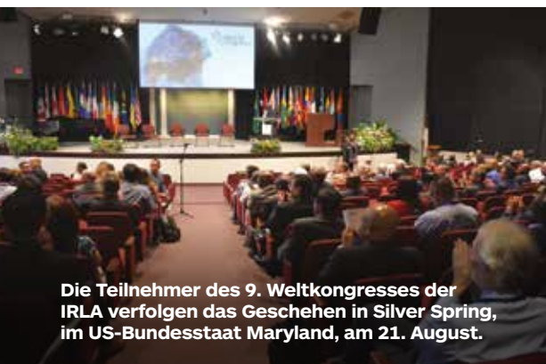
Die Teilnehmer des 9. Weltkongresses der IRLA verfolgen das Geschehen in Silver Spring, im US-Bundesstaat Maryland, am 21. August.

Die IRLA wurde 1893 von einer Gruppe Siebentags-Adventisten gegründet, die über religiöse Verfolgung und Diskriminierung besorgt waren. Die Organisation setzt sich für die Religionsfreiheit aller Menschen ein, unabhängig von ihrem Glauben und ihrer Herkunft. „Die IRLA befasst sich mit Fragen der Religionsfreiheit und bietet Unterstützung und Ressourcen für Einzelpersonen und Gemeinschaften, die mit Verfolgung konfrontiert sind“, so die Leiter der Organisation. „Außerdem fördert sie den Dialog und die Zusammenarbeit zwischen Menschen verschiedener Glaubensrichtungen und philosophischer Überzeugungen.“ ©